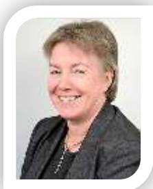
Kate Chamberlain – Prif Weithredwr

Gan edrych i'r dyfodol, ni fydd yr AGLI a goruchwyliaeth yn parhau yn rhan o deddfwriaeth y Cyngor Nyrsio a Bydwreigiaeth. Mae'r Prif Swyddog Nyrsio wedi sefydlu tasglu er mwyn trosglwyddo goruchwylio bydwagedd i fodel sy'n cael ei arwain gan gyflogwyr, er mwyn sicrhau bod goruchwylwyr bydwagedd yn parhau i gael dylanwad ac yn cefnogi rhagoriaeth mewn ymarfer bydwreigiaeth. Yn y cyfamser, rwy'n hyderus bod yr AGLI mewn sefyllfa dda i gynnal y gwaith o ddarparu goruchwyliaeth bydwreigiaeth statudol tra bydd y newidiadau deddfwriaethol yn cael eu gwneud.